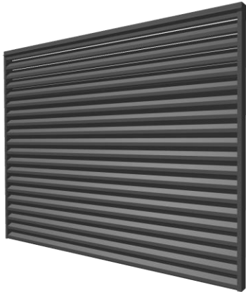
ВИД С УЛИЦЫ