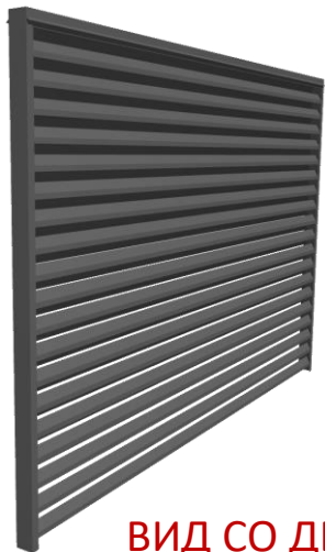
ВИД СО ДВОРА

Для резки металла нельзя использовать УШМ («болгарку»)